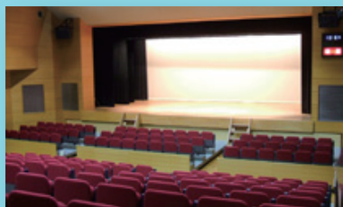
月島社会教育会館 4階ホール

■ 参加費: 2,000円(要予約) 3,000円(当日)、1,000円(学生)